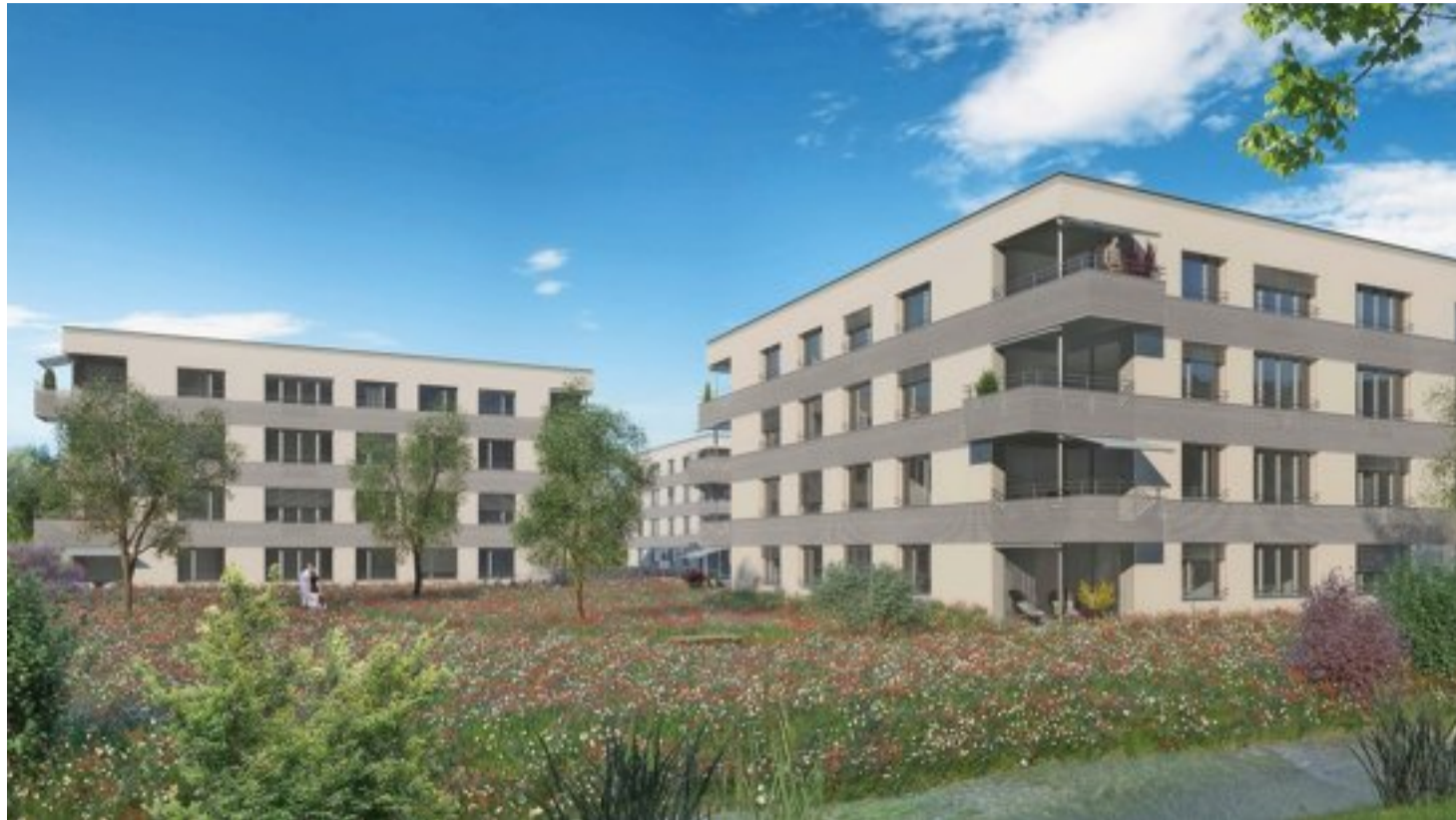
Die geplanten Häuser an der Thunstrasse unterscheiden sich äusserlich kaum, die Grösse und Grundrisse der Wohnungen sind jedoch uneinheitlich.

Bei dieser genossenschaftlich organisierten Wohnform werde bezahlbarem Wohnraum ebenso Gewicht beigemessen wie einem