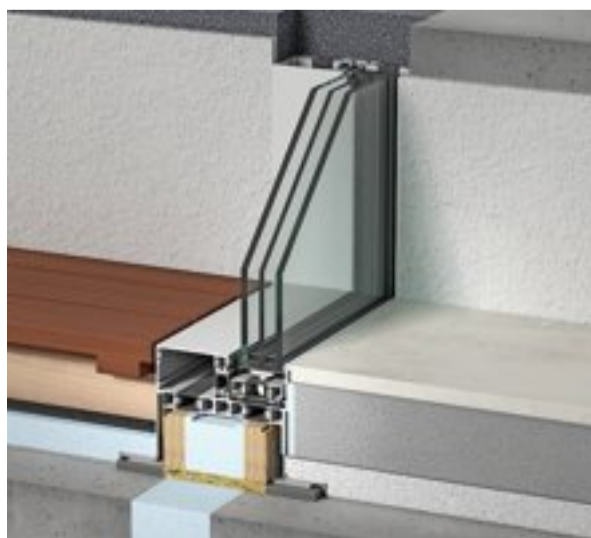
Dreifachverglasung: Das Fenstersystem ist eine Eigenproduktion der Berger Metallbau AG.

«Das System Swiss Fine Line S entspricht dem Minergie-passiv-Standard, was der Ästhetik des Fensters aber keinen Abbruch tut.»